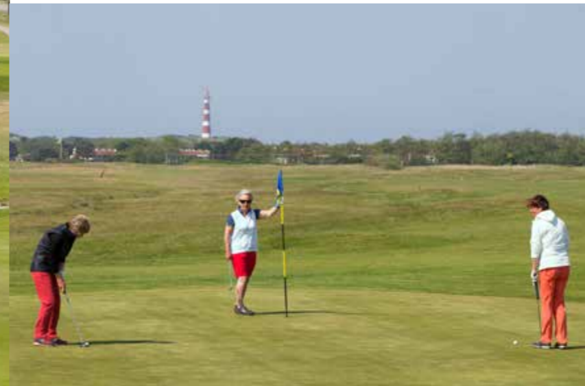
► DE GREENS ZIJN VAN UITMUNTENDE KWALITEIT.