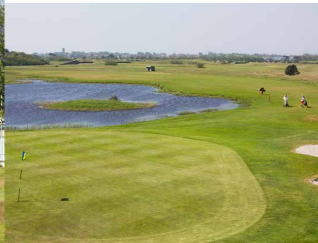
► JE HEBT TWEE GOEDE SLAGEN NODIG OM DE WATERHINDERNIS OP DE PAR-4 VIJFDE TE ONTWIJKEN.