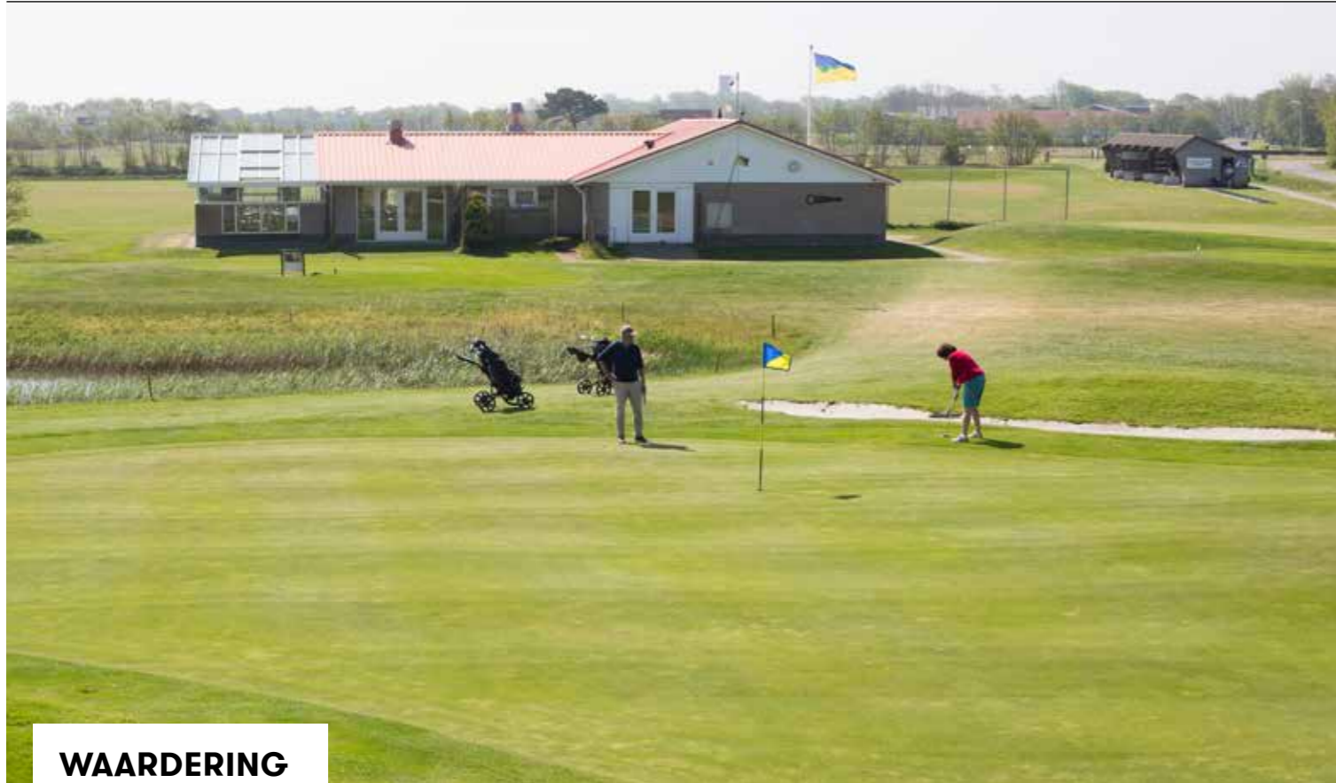
► FOTO LINKS: HET PARKEERTERRAIN IS EEN STUKJE LOPEN, MAAR VOOR DE REST IS ALLES LEKKER COMPACT: DE GREEN VAN ACHTTIEN LIGT PAL NAAST DE EERSTE TEE EN HET KNUSSE CLUBHUIS, MET DAAR WEER DIRECT ACHTER DE DRIVINGRANGE.