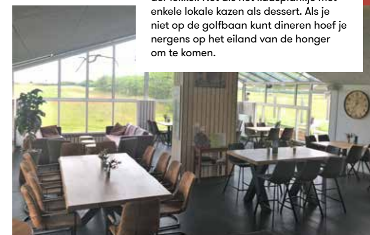
► HET RESTAURANT IN HET CLUBHUIS KREEG DIT JAAR EEN FLINKE OPKNAPBEURT.

De baan heeft moeilijke tijden gekend, zo leren we in het clubhuis. Een paar jaar geleden was de executieverkoop aanstaande en konden de huidige eigenaren maar net voorkomen dat de bank dat plan doorzette. Sindsdien is er veel gebeurd, vooral op het gebied van onderhoud, en dat zie je duidelijk terug in de baan, die er uitstekend bijligt. Vooral de greens verdienen een speciale vermelding, want de kwaliteit daarvan is ongekend. Mooi in het gras, uitstekende rol en precies hard genoeg om je wel dat typische linksgevoel te geven, terwijl je tegelijkertijd een hoog aangespeelde bal niet meteen kwijt bent. En omdat de meeste holes open en bloot in het land liggen, weet je zeker dat ook de wind een rol speelt bij je putt. Wij houden ervan. Negen holes telt de baan. Er waren ooit wel plannen om uit te breiden naar achttien, ☺