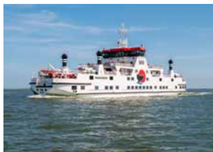
► MET DE BOOT NAAR DE OVERKANT. AMELAND VRAAGT GEWOON OM EEN MEERDAAGS BEZOEK.

De moeilijkste hole van de baan is de par-4 zevende waar je van de tee een goede slag nodig hebt om de rough te ontwijken. Hole zes had overigens net zo goed ingeschaald kunnen worden als moeilijkste. Links en rechts van de fairway kleine duintjes met daarop lastige rough. Gelukkig is het gras tussen de heuveltjes korter gemaaid, maar een ideale ligging heb je niet als je de fairway mist. Diezelfde heuvels onttrekken weer deels je zicht. En als je de green rechts mist, pak dan maar vast een nieuwe bal. Hole acht is met ruim vijfhonderd meter van wit, de langste hole van de baan en is, afhankelijk van de windrichting, óf een monster waar je drie houtjes voor nodig hebt óf heel goed voor je ego. Wij hadden bij ons bezoek de wind vol in de rug, raakten de bal twee keer goed, waardoor we ook nog eens volop rol meekregen, en sloegen de bal pardoes op de rand van de green. Dat we vervolgens een rommeltje maakten van de chip uit het hoge gras voor de green, mocht de pret niet drukken. Zoals niets dat eigenlijk deed tijdens onze tweedaagse aan de overkant. ☺